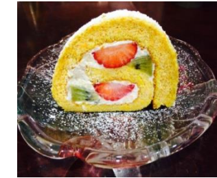
おなかにやさしいロールケーキ