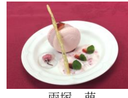
苺のご褒美マカロン