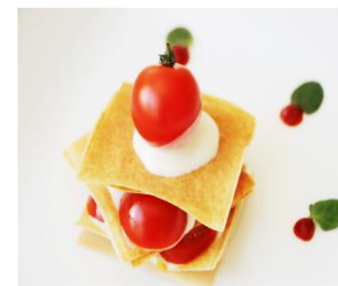
はちみつトマトのミルフィーユ