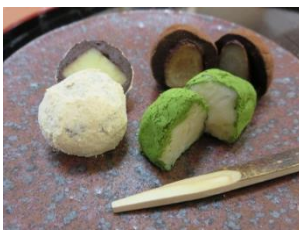
根菜和風トリュフ