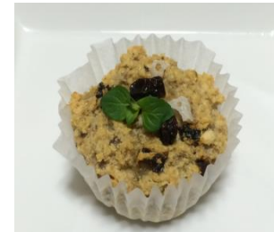
おからと蓮根のカップケーキ