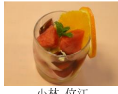
紅茶フルーツパフェ