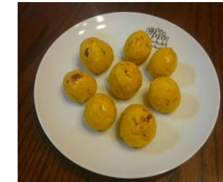
スイートパン麩キン