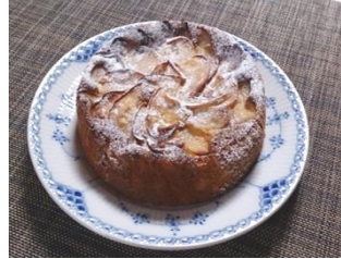
長芋とりんごのケーキ