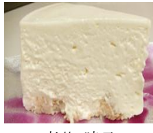
長いものチーズスフレ