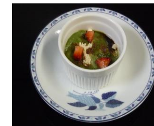
春らんまん 和なごみプリン