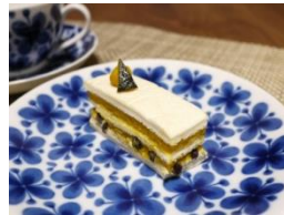
南瓜とチーズのミルフィーユ風