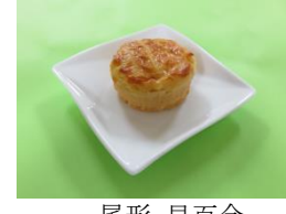
とうきびソフトガレット