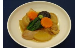
～室生犀星の故郷金沢の 味から～ 治部煮