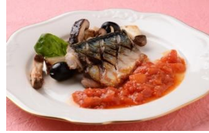
鯖のカリカリ焼き きのことトマトの歯ごたえのあるソース