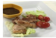
鶏肉にハニーマスタードを ディップして