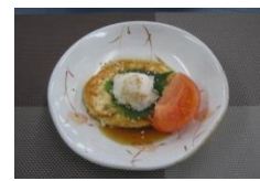
野菜たっぷりハンバーグ