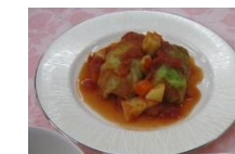
高野豆腐入りロールキャベツ