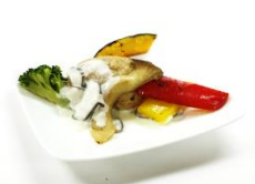
高野豆腐入り さつきバーグ